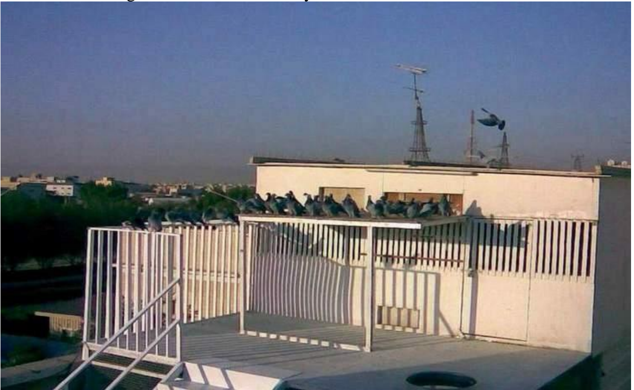
VUE PANORAMIQUE; Pigeonnier de Adil ALHADYA